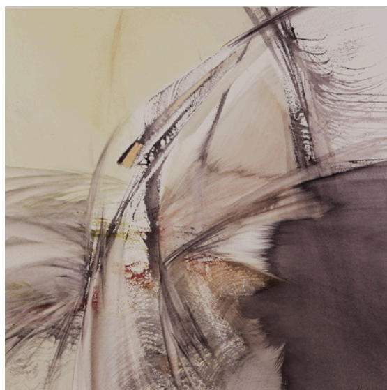
Oiseau Aquarelle sur papier, 2015 H. 50 x L. 50 cm

Mes compositions sont abstraites mais je cherche à rendre cette surface (j'ai envie de dire « cette peau », maintenant !) animée, j'aspire à ce qu'on y sente des vibrations, des rythmes, du vivant, de la profondeur. Je suis très sensible à l'attitude des visiteurs peu avertis devant mes œuvres. Souvent, leur première réaction est de dire « Ce n'est pas le genre de peinture que j'aime, je n'y comprends rien... » puis le point de vue évolue, au fur et à mesure de la visite, cela devient « On sent que ce n'est pas n'importe quoi, ça me touche ». C'est exactement là que je veux être.